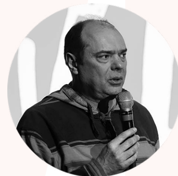
Lubomir Guéorguiev President

NL In een tijd van breuken en verhalen die tegenstellingen creëren, biedt documentairefilm ons een ander perspectief. Het geeft geen garanties of dogma's, maar een ontmoeting met de werkelijkheid, met unieke stemmen en verhalen die ons verbinden. Samenbrengen zonder verschillen uit te wissen, begrijpen zonder te vereenvoudigen, een ruimte creëren waar dialoog kan ontstaan: misschien is dat het begin van het verhaal dat we zoeken. Dit jaar nodigen we u uit om te durven reflecteren, uzelf ten volle te ontplooiën, uw innerlijk potentieel te openen en te creëren en deel te nemen aan de toekomst die u wilt beleven.